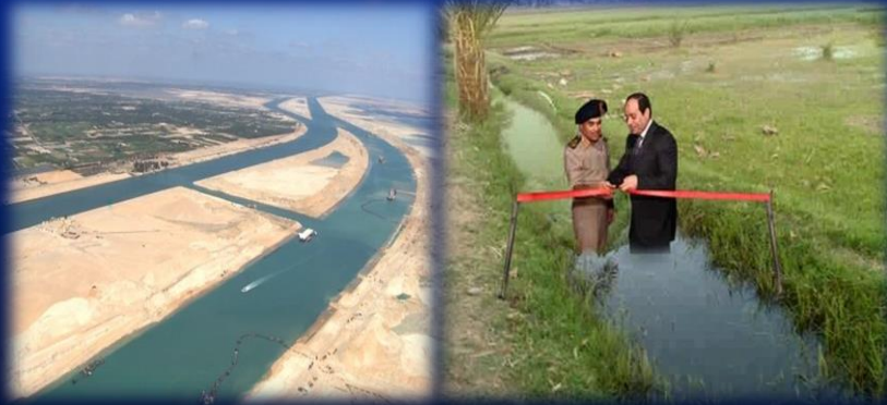
( قناة السويس الجديدة ترعة )

هي التي يتم ترويجهما وإنتشارها ببطيء، كالشائعات العدائية التي تستهدف القرارات السياسية والعسكرية بهدف ( التحقير منها – فقد الثقة – عرقلة خطوات التقدم الإقتصادي والسياسة – التشكيك في قدرات وإمكانيات القوات المسلحة ) .