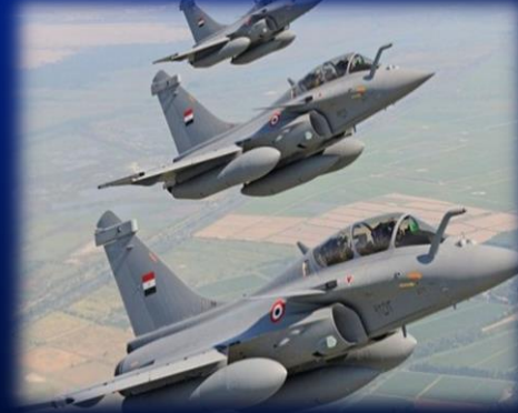
( طائرات الرافال طراز قديم وبها عيوب )